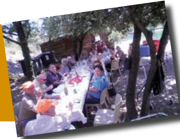
L'EHPAD les Arcades reçoit son homologue de Bédoin pour un pique nique à l'étang de Bel Air