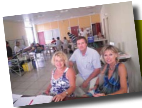
Don du Sang Collecte exceptionnelle 52 donateurs