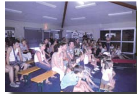
Matinée récréative. Session d'été de l'Accueil Loisirs Sans Hébergement (ALSH)