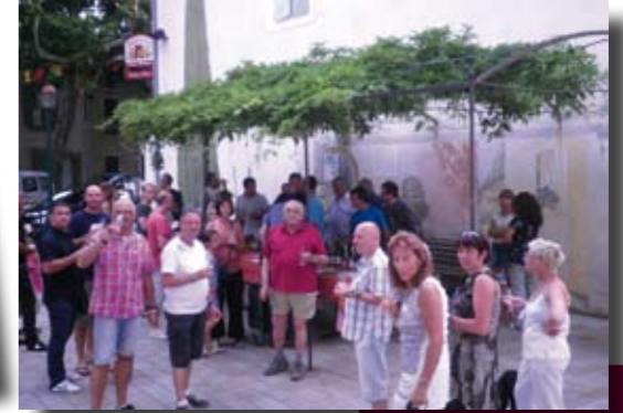
Visites du village pour les estivants par André Tounillon et dégustation des vins du terroir.