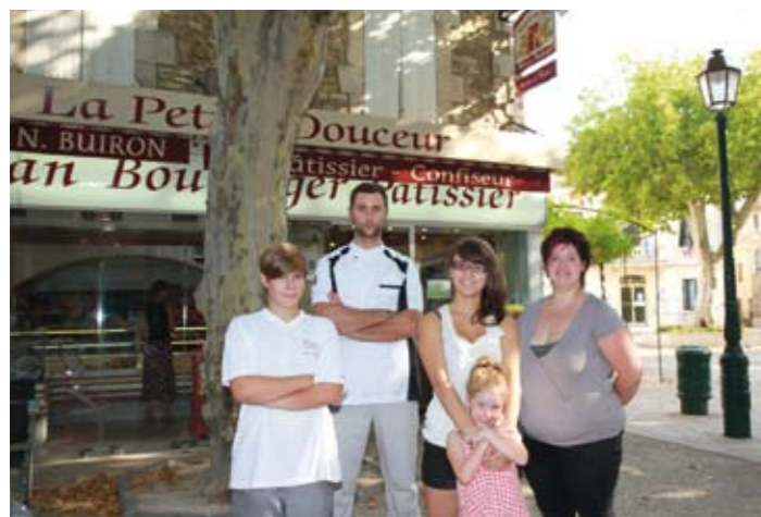
La nouvelle équipe de la Petite Douceur.