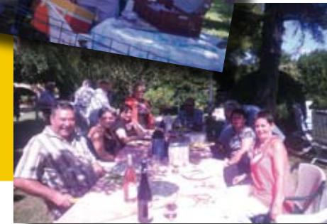
Repas de quartier Bosquet et Caffin