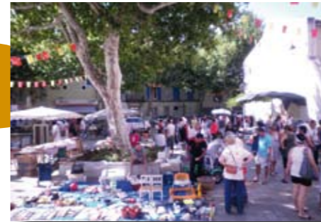
Vide-grenier dans le village