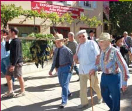
Le raisin est mûr, les vendanges peuvent commencer