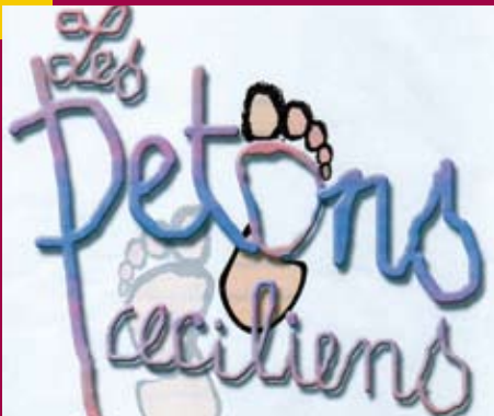
Les Petons Céciliens font leur rentrée ...