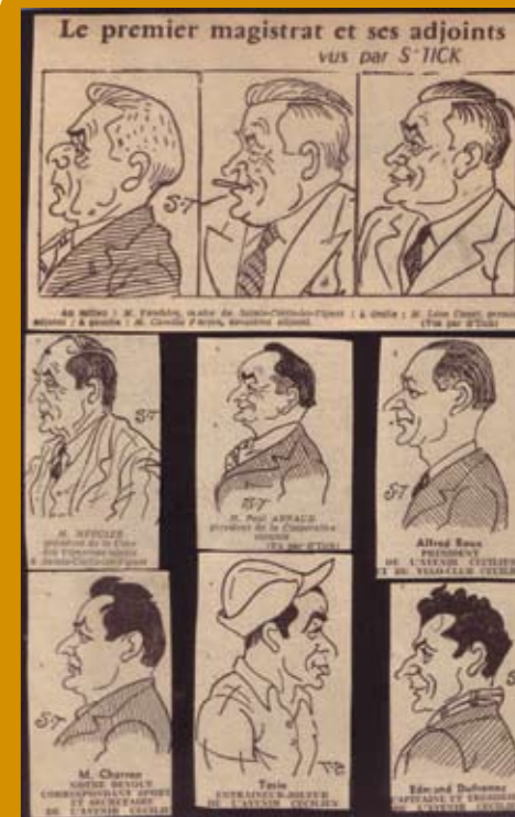
Parution de ces caricatures dans le quotidien «LE PROVENÇAL» en 1954