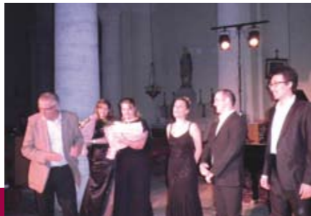
Musiques dans les Vignes. Un quatuor de choc...CNIPAL