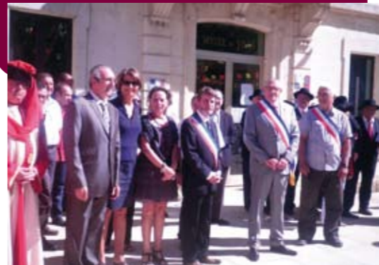
Proclamation du Ban des Vendanges 2011 : Sainte-Cécile-les-Vignes, Lagarde Paréol et Cairanne.....