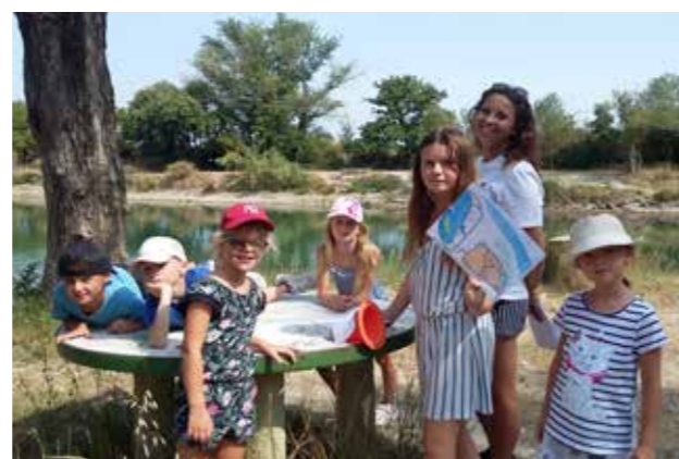
► Matinée à l'étang de Sainte-Cécile-les-Vignes, Observation et nourrissage des canards... Et pêche à la ligne. Et pendant ce temps, les renards et les loups étaient en pleine course d'orientation avec des questions sur la faune et la flore du lieu...