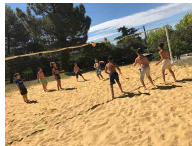
► TOURNOI DE BEACH VOLLEY ...