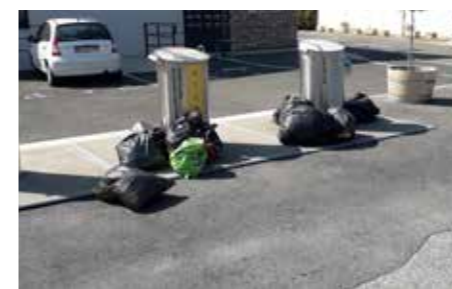
► Dépôt de poubelles Myosotis II.