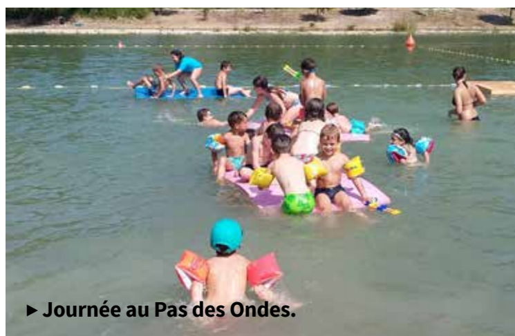
► Journée au Pas des Ondes.