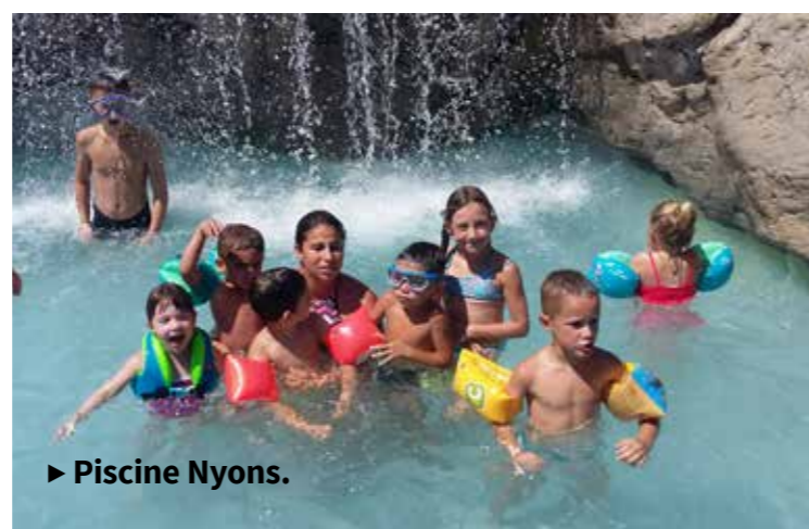
► Piscine Nyons.