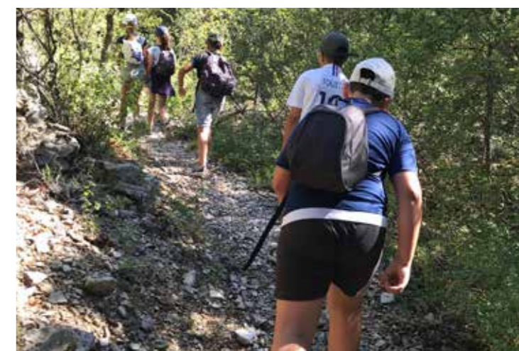
► RANDONNÉE DANS LA COMBE DE CURNIER... Passage dans un canyon