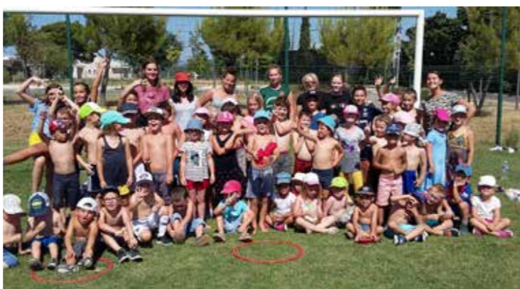
► Jeux d'eau tous ensemble vendredi !