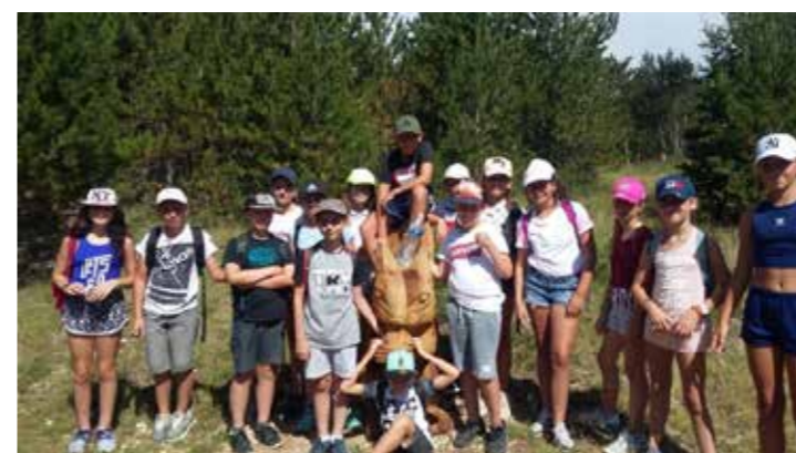
► DE RETOUR SUR LES PENTES DU VENTOUX POUR LA BALADE DES PITCHOUNES