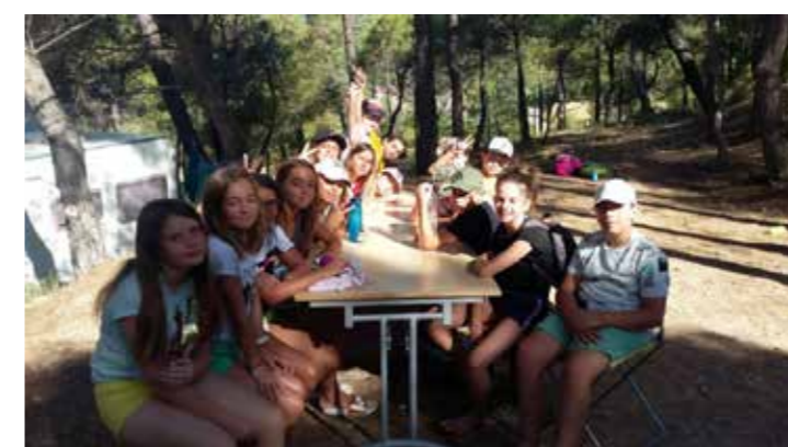
► PETIT DÉJ. APRÈS UNE NUIT BIEN COURTE !