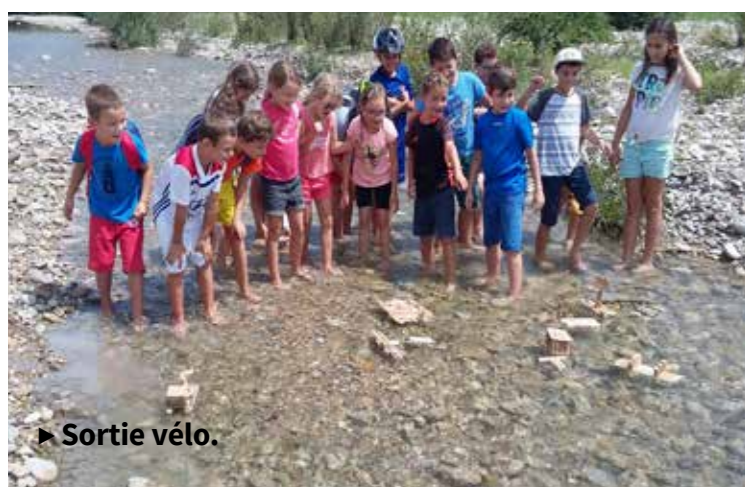
► Sortie vélo.