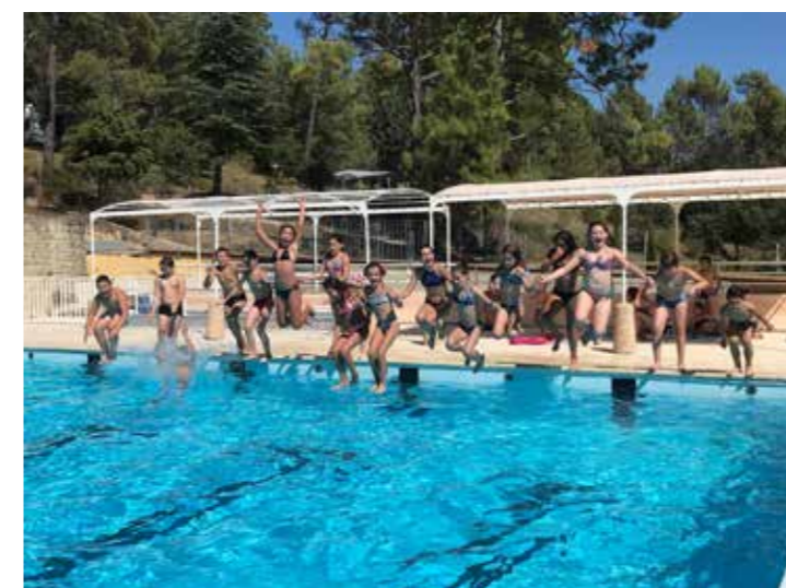
► UNE FOIS LES TENTES MONTÉES, DÉTENTE À LA PISCINE !