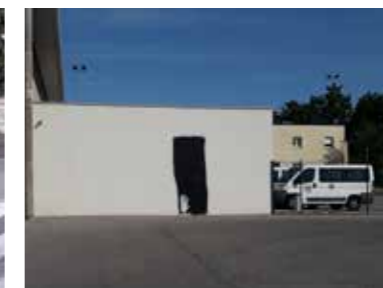
► Tag sur le mur du gymnase.