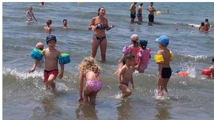
► Après le seaquarium... baignade et châteaux de sable !