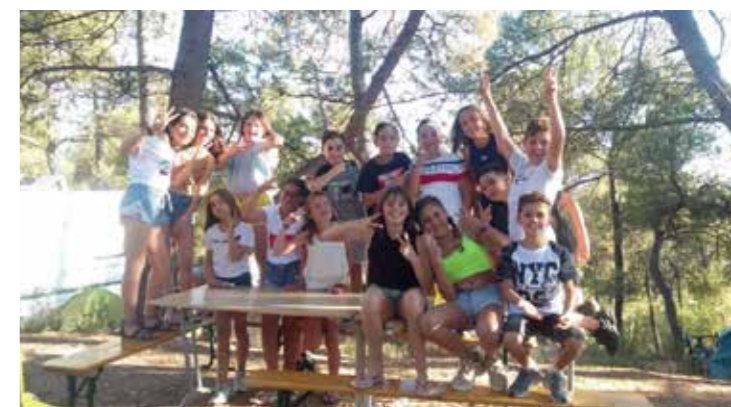
► APRÈS UNE BONNE DOUCHE.... DIRECTION LE RESTO !