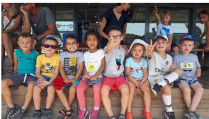
► Les petits loups regardent travailler les otaries...