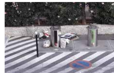
► Parking de la mairie.