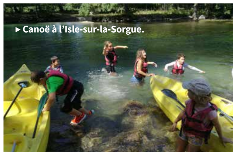
► Canoë à l'Isle-sur-la-Sorgue.