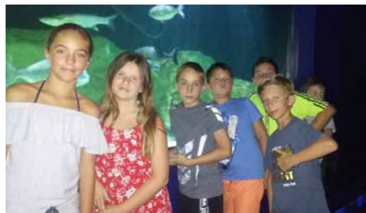
► Sortie au seaquarium