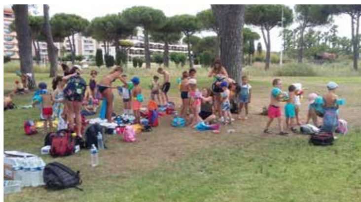
► Préparation pour le grand bain !