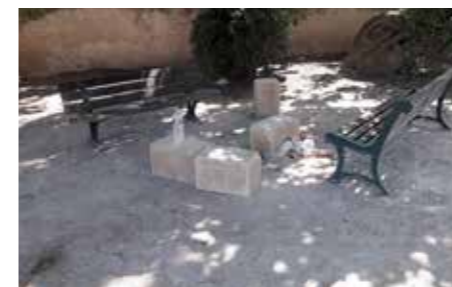
► Le coin ados.

L'acte d'incivisme peut-être réprimandé et faire l'objet d'une sévère amende (135 euros).