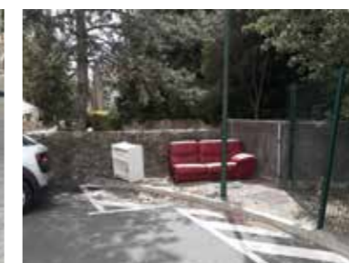
► Dépôt Rue des Arcades.