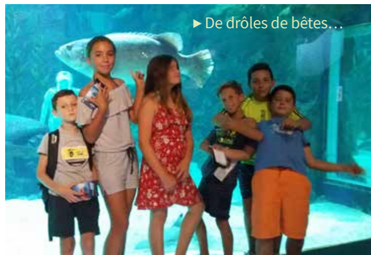
► De drôles de bêtes...