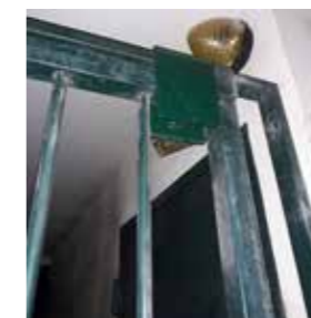
► Cadenassage du passage Castiglione par tierce personne.