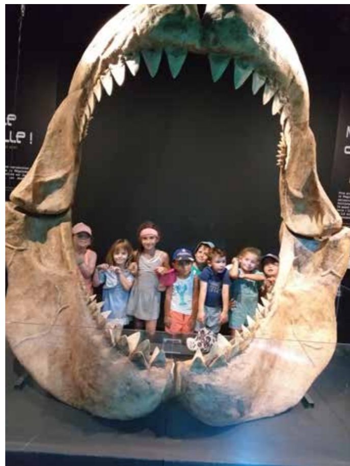
► Avec une dentition impressionnante !