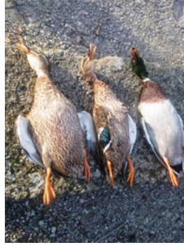
► Canards à l'Étang de Bel Air