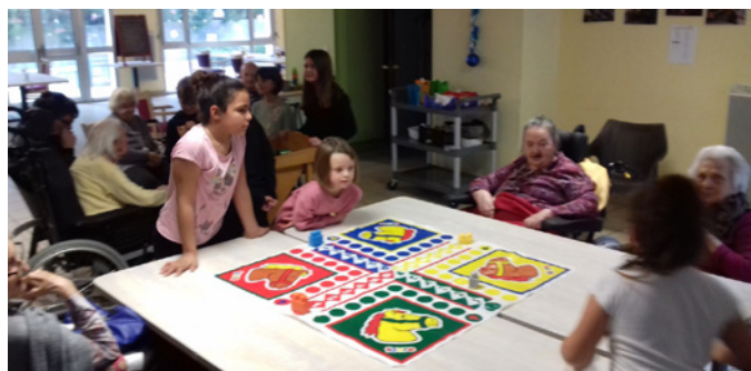
Mercredi 16 janvier.

Les enfants du centre de loisirs, de 6 à 10 ans, sont venus passer un moment récréatif autour du jeu, pour le plaisir de tous. Beaucoup d'échanges et de joie ont animé cet après midi.