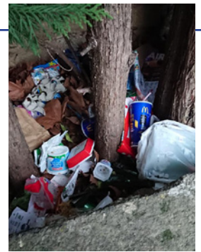
► Dépôt sauvage