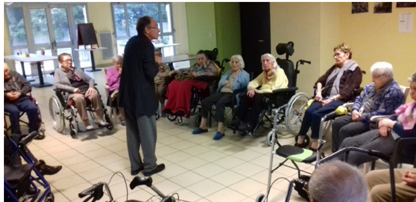
Rencontre intergénérationnelle entre l'EHPAD et le Centre de Loisirs.

Le mercredi 6 Février, les résidents et le personnel ont partagé un repas chinois concocté par l'équipe de cuisine. La décoration des tables et de la salle, a été confectionnée par les résidents lors d'ateliers créatifs.