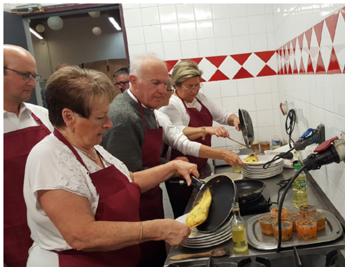
«Les cuistots en action»