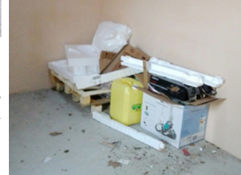
Local à cartons des commerçants ►