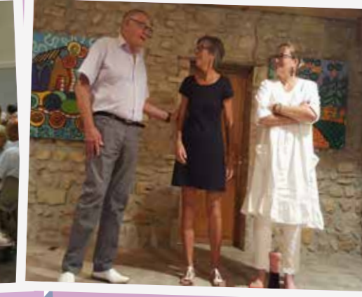
► Le 17 août. 140 repas ont été servis lors de la soirée «Ciné C» exceptionnellement à la salle Camille Farjon en raison du mauvais temps. Film présenté : «Larguées»