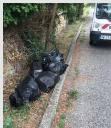
► Dépôt sauvage, inadmissible. Préservons notre environnement.