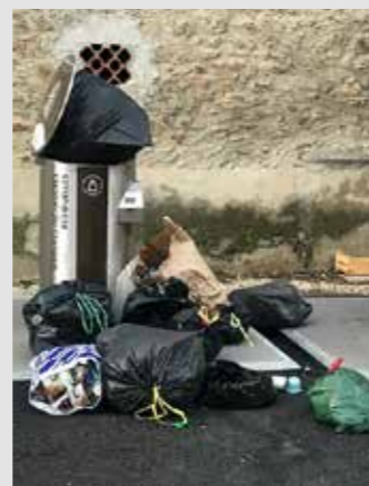
► Taille du sac inadéquate. Sac préconisé de 30 litres.