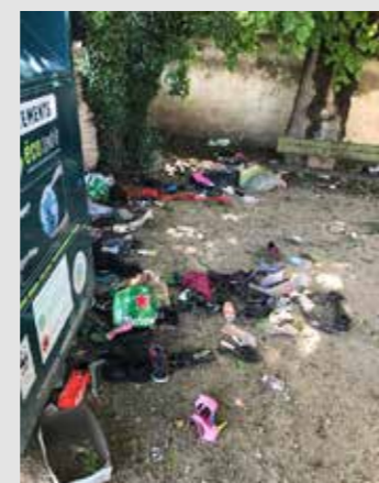
► Aucun respect.