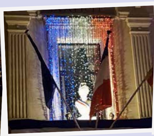
► Le 14 juillet. Orchestre Nouvelle Vague Laurent Comtat.