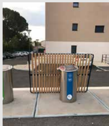
► Enlèvement des encombrants tous les premiers mardis du mois. Sur simple inscription en mairie.