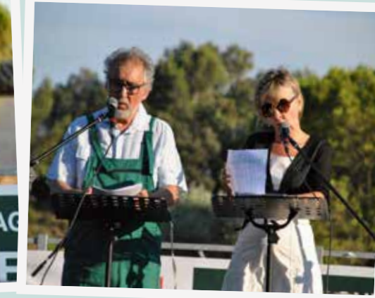
► Le 6 juillet. «La Belle soirée» au Domaine des Grands Bois.