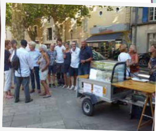
► Visite guidée, marché provençal et dégustation des vins du terroir. Proposés tous les mardis aux amis vacanciers par les vignerons de notre village.