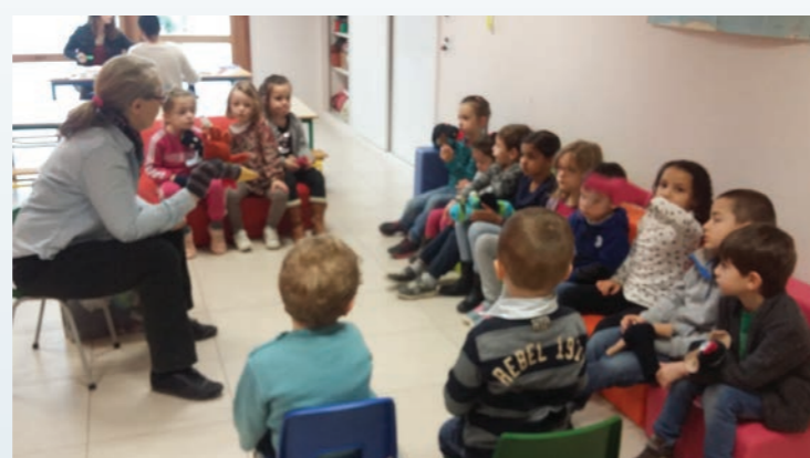
Lecture de contes