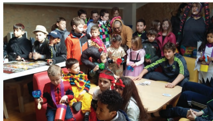
Carnaval dans Sainte-Cécile-les-Vignes