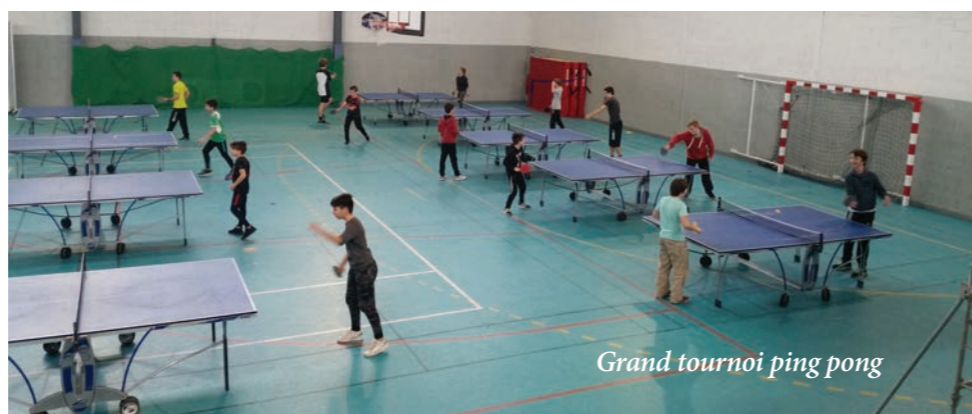
Grand tournoi ping pong