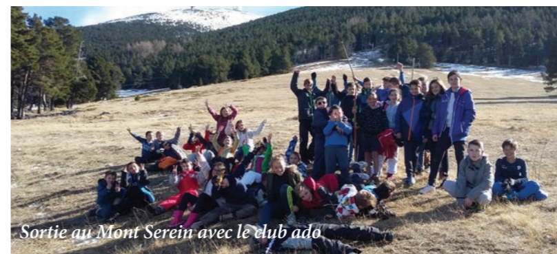
Sortie au Mont Serein avec le club ado