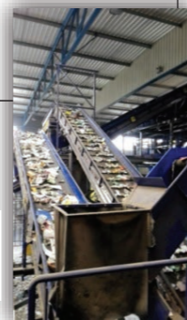
Le centre de tri de Nîmes

Suivez l'actualité de votre communauté de communes sur www.ccayguesouveze.com