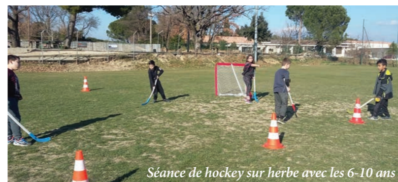
Séance de hockey sur herbe avec les 6-10 ans