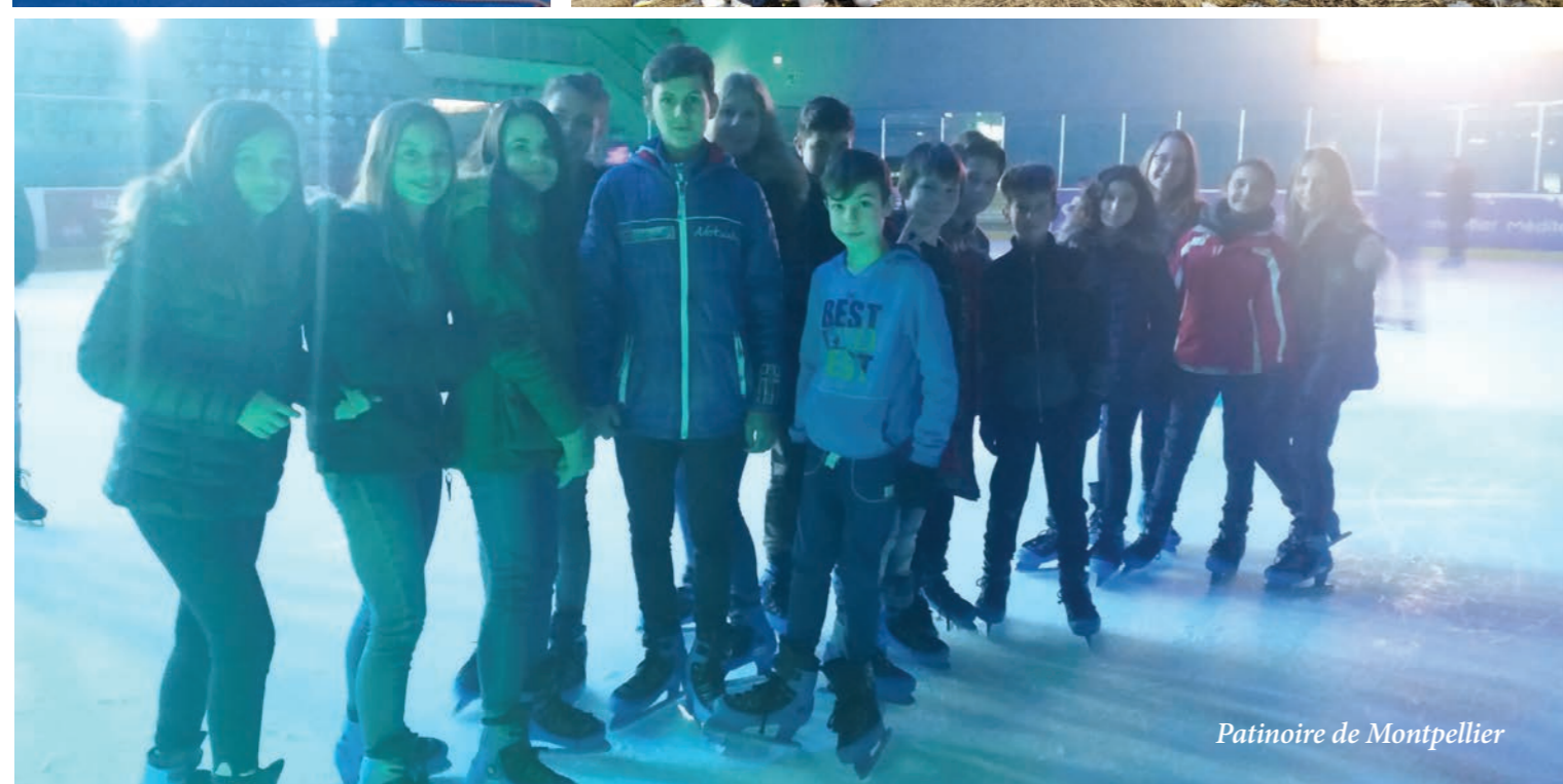
Patinoire de Montpellier