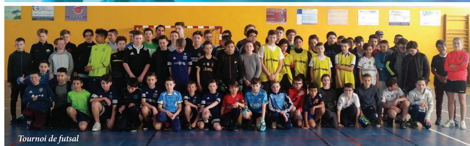
Tournoi de futsal