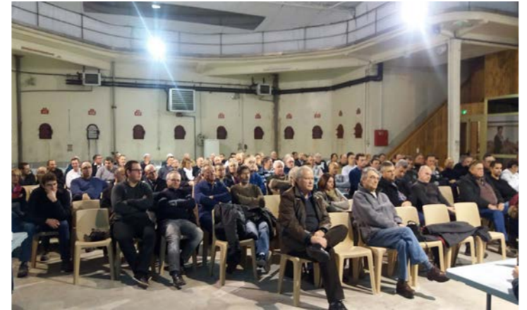
Assemblée Générale des Vignerons Réunis.