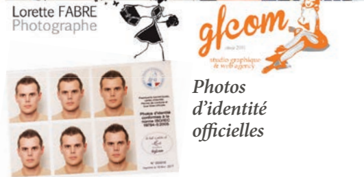
Photos d'identité officielles

Ces deux entreprises céciliennes ont eu l'occasion de renforcer tout dernièrement leur partenariat par l'extension des locaux de GFCOM. Elles travaillaient déjà main dans la main pour l'élaboration de sites internet. En mettant en commun leur savoir-faire respectif (graphisme, web designer, communication visuelle pour GFCOM, et prises de vues photographiques pour Lorette) et leur créativité, chacune met en œuvre le meilleur pour offrir une communication optimale à leurs clients qui sont à ce jour principalement les chambres d'hôtes, hôtels, restaurants, vigneron, offices de tourisme. Aujourd'hui, Lorette a investi dans une solution « photo » permettant d'obtenir à partir de clés USB, cartes mémoires, CD, DVD (...) des tirages de qualité sur papier glacé. Une large gamme de formats vous est proposée: du 10x15 au 20x60cm (du classique, du carré ou encore du panoramique). Mais ce n'est pas tout, GFCOM met en avant son traceur permettant d'obtenir très