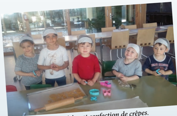
Atelier cuisine et confection de crêpes.