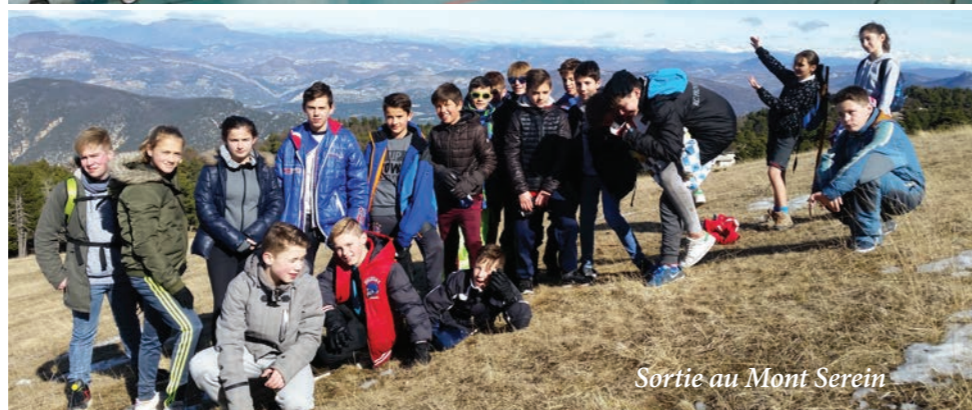
Sortie au Mont Serein