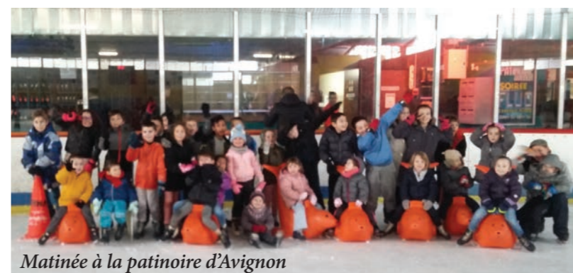
Matinée à la patinoire d'Avignon