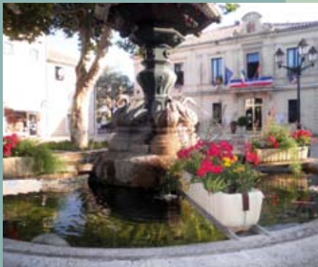
L'information municipale en direct.