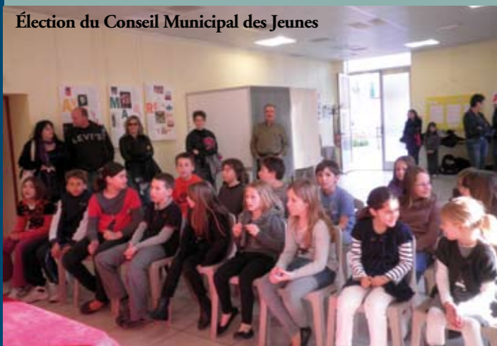
Élection du Conseil Municipal des Jeunes