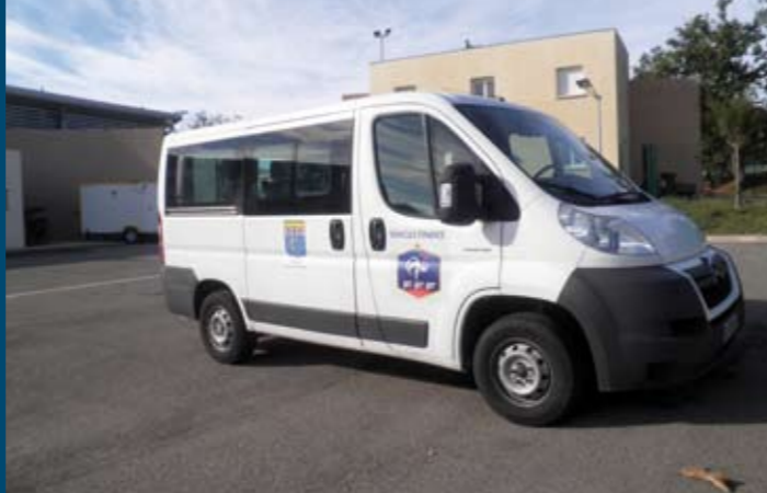
Deux mini-bus pour le RCP