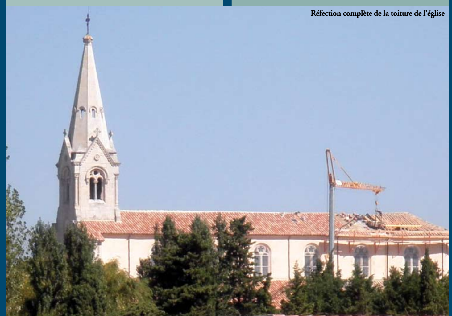
Réfection complète de la toiture de l'église