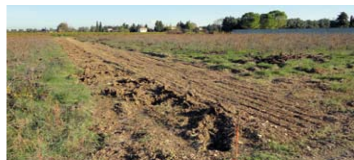
Photo : emplacement pour l'installation de la clôture et installation du 2 ème columbarium dans le cimetière actuel

C'est maintenant les entreprises Floréal et Sagnol qui vont pouvoir démarrer le mur et la clôture.