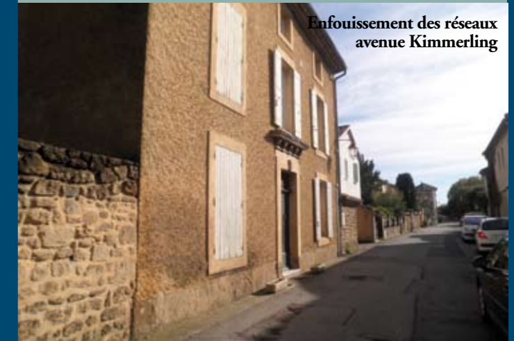
Enfouissement des réseaux avenue Kimmerling