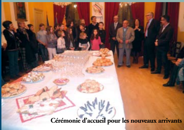
Cérémonie d'accueil pour les nouveaux arrivants