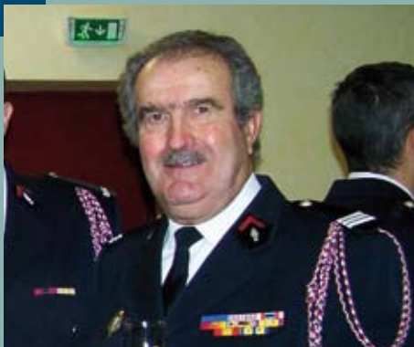
Hommage à Pierre Flour