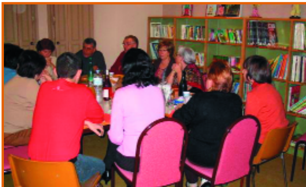
Assemblée générale de l'atelier d'écriture "Levez l'Encre"