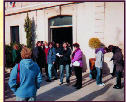
Téléthon : bilan 2004