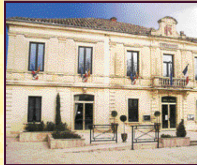
L'information municipale en direct