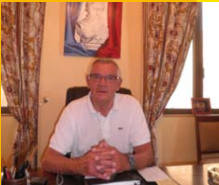
L'information municipale en direct.