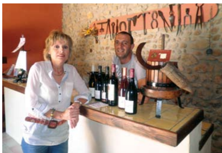
Vernissage au caveau « Château des Quatre Filles » Jeudi 19 juillet à partir de 19 heures.