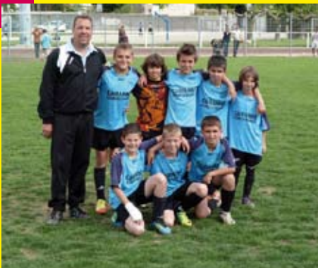
Félicitations U11 (poussins) champion saison 2011-2012