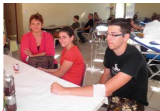
Une collecte de sang réussie grâce à la fidélité de ses donateurs dont 56 se sont présentés, 4 nouveaux... Un bel élan de générosité ! Prochaine collecte lundi 27 août....