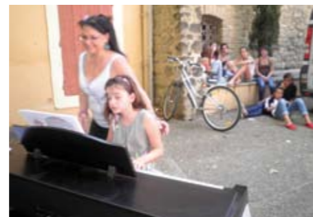
Fête de la musique dans les rues du village.

72ème anniversaire de l'Appel Historique du 18 juin 1940.