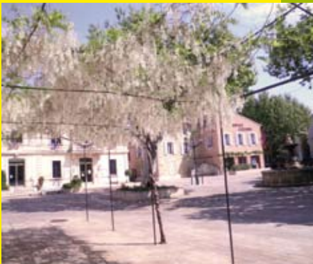
L'information municipale en direct.