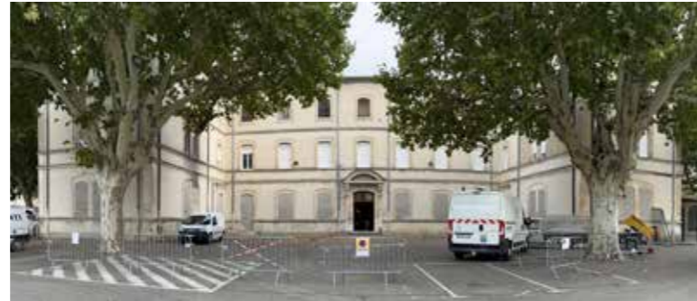
Ecole Louis GAUTHIER

Les travaux, qui ont débuté le 23 octobre, entraînent la perte des places de stationnement situées dans l'emprise du projet. Les automobilistes sont invités à stationner leurs véhicules sur le parking de la route de Bollène. L'accès à l'école maternelle Louis GAUTHIER depuis le parking sera réaménagé.