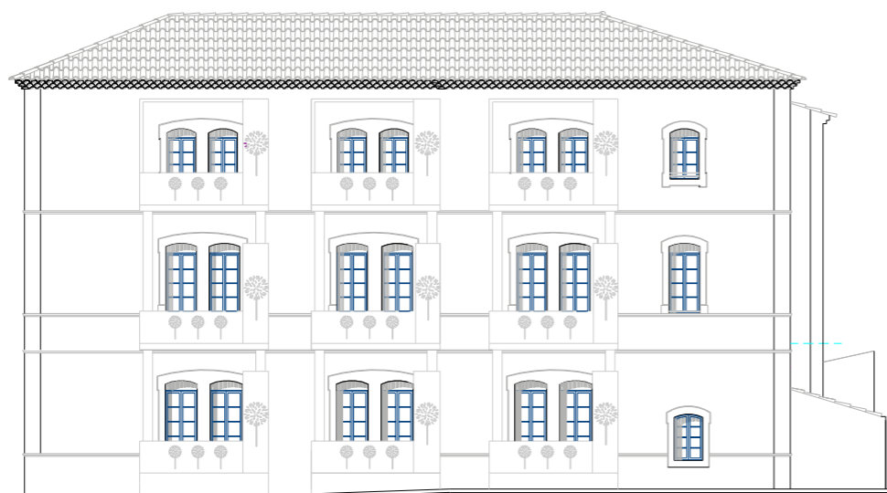
Plans : © Martine MILLET – Architecte - Bollène