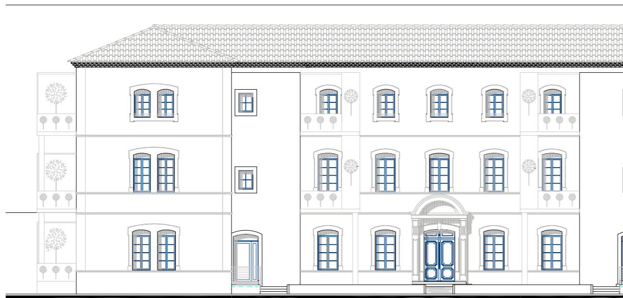
Projet Ecole Louis GAUTHIER