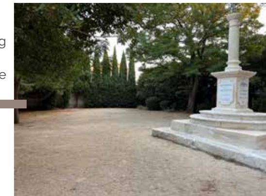
→ Nettoyage du jardin de la Chapelle.