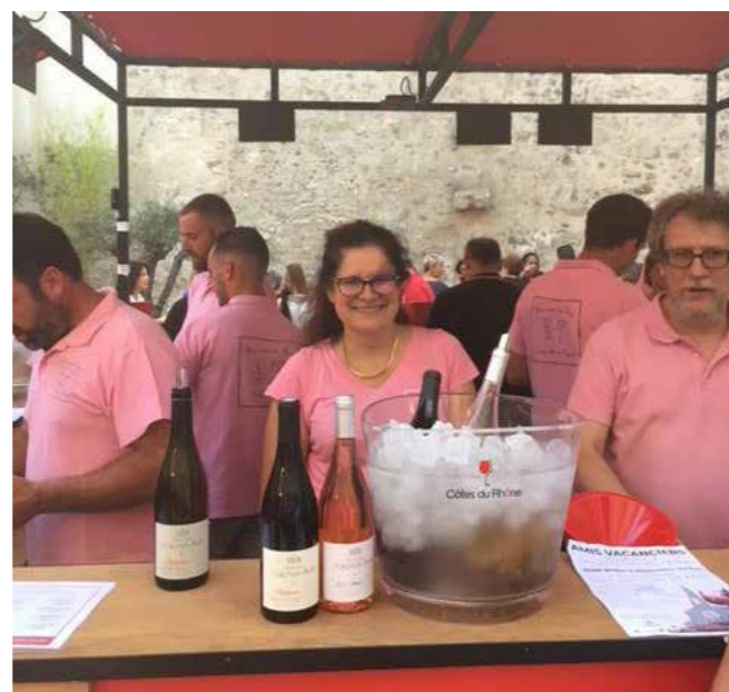
Fête du Rosé, Ban des Vendanges...), comme les années précédentes et vous accueillir nombreux.

Nous espérons cette année pouvoir reconduire les diverses manifestations (accueil des touristes, Bar à Vins,