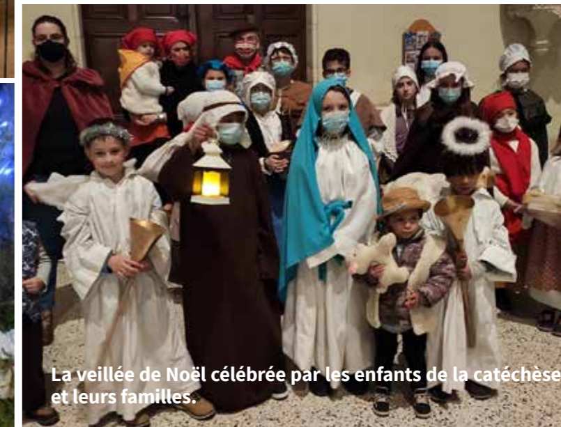
La veillée de Noël célébrée par les enfants de la catéchèse et leurs familles.