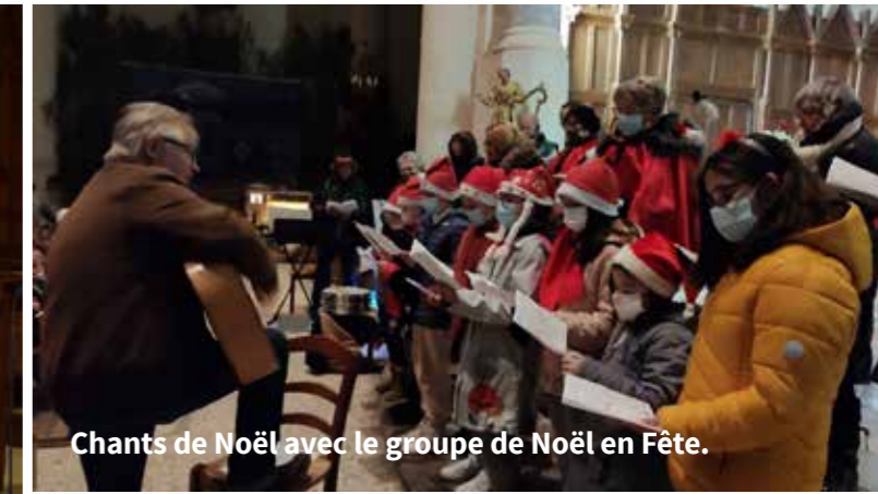
Chants de Noël avec le groupe de Noël en Fête.