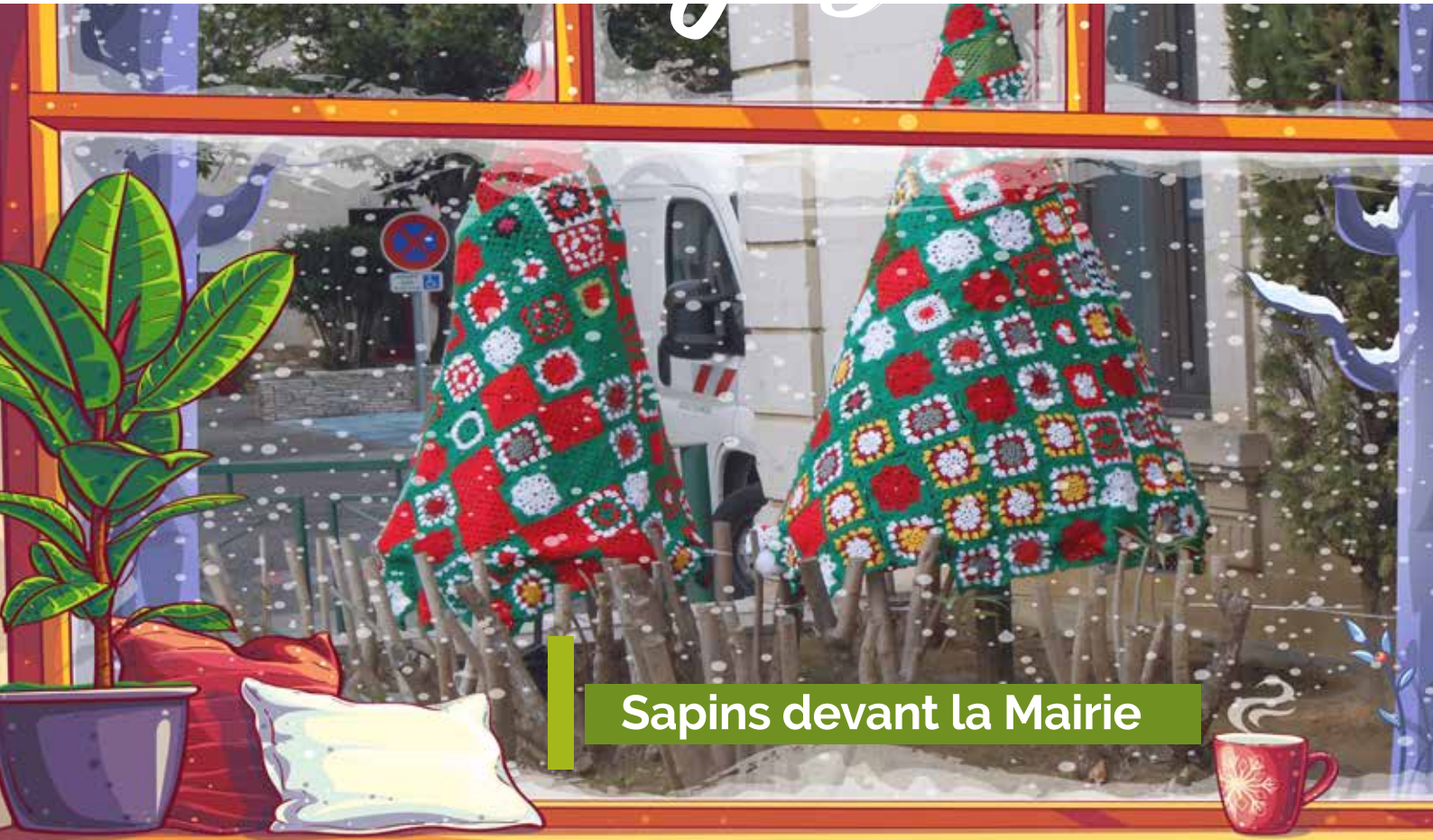
Sapins devant la Mairie