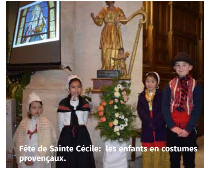
Fête de Sainte Cécile: les enfants en costumes provençaux.