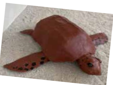
Un grand bravo aux enfants et animateurs !