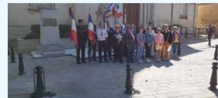
Cérémonie commémorative du 78 ème anniversaire de la victoire du 8 mai 1945.