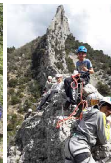
CLUB ADOS VIA FERRATA