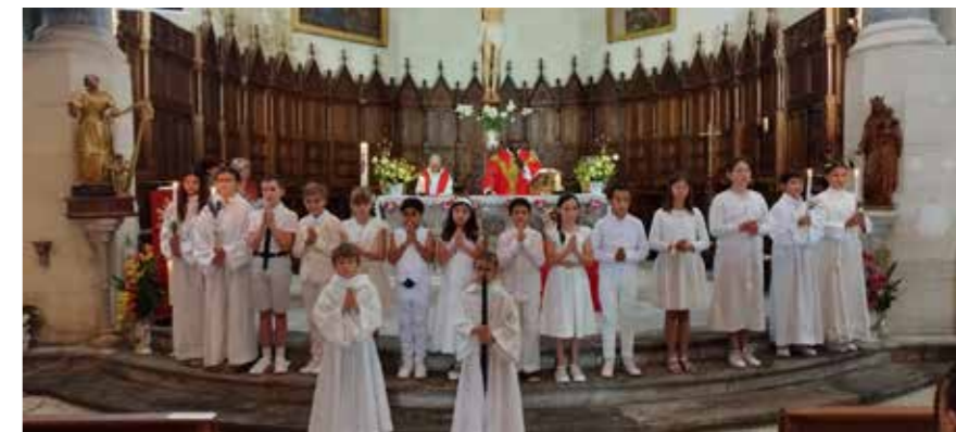
Communions et professions de Foi des enfants de Ste-Cécile-les-Vignes et Cairanne

Contacts ☎ 07 65 71 42 22 ✉ paroisses84290@gmail.com