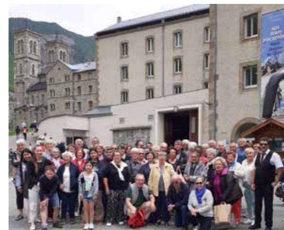
Pèlerinage à Notre Dame de la Salette secteur paroissial de Ste-Cécile-les-Vignes et Pernes-les-Fontaines et les Valayans