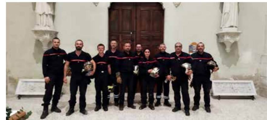
Exercice des pompiers sur le toit de l'église

► Le dimanche 6 Août aura lieu la messe en provençal dans le jardin de la chapelle.