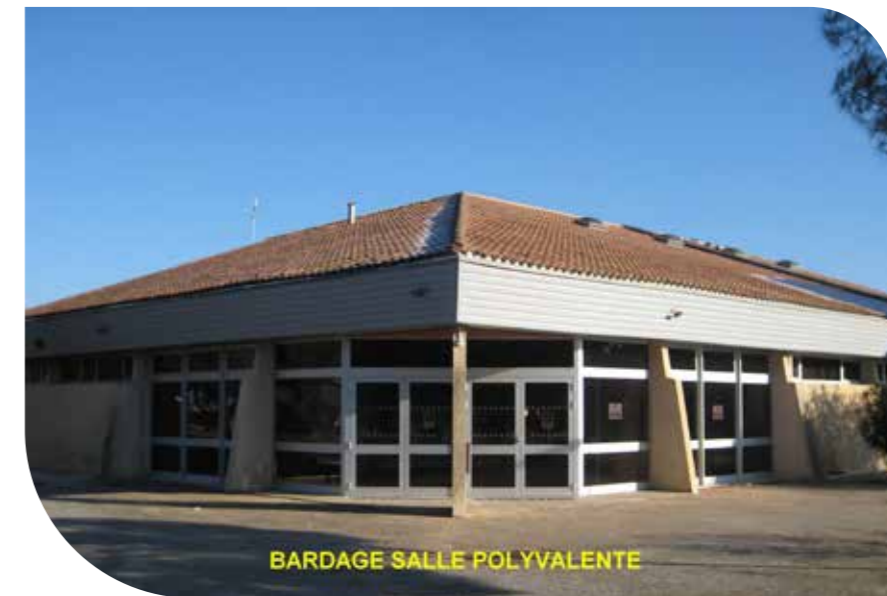
BARDAGE SALLE POLYVALENTE