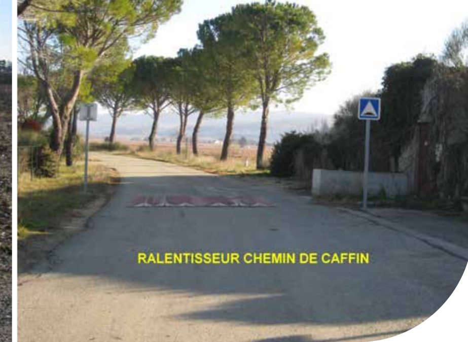
RALENTISSEUR CHEMIN DE CAFFIN