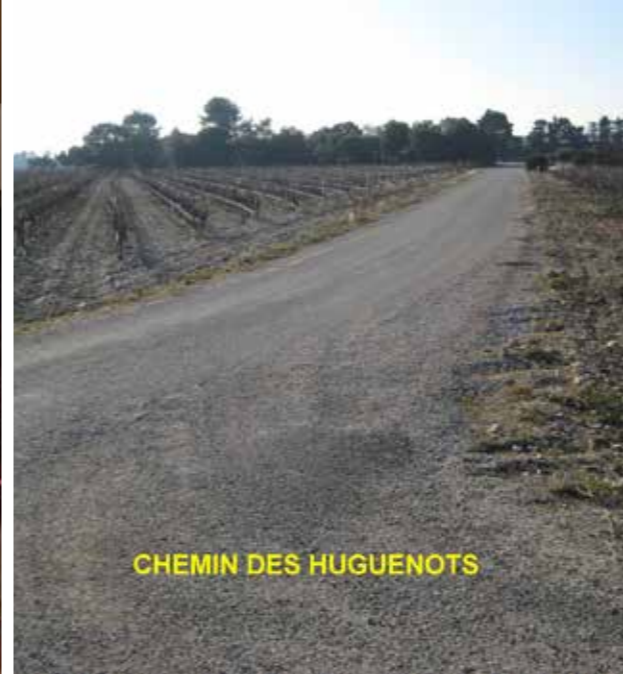
CHEMIN DES HUGUENOTS